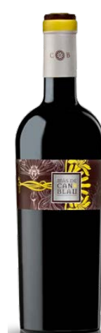
Mas de Can Blau 35% Carinyena, 35% Syrah 30% Garnatxa 18 mesos barrica