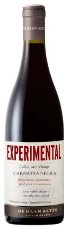
Experimental Negre 100% Garnatxa Negre