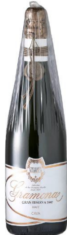
Cellar Battle Gran Reserva Brut Xarel·lo, Macabeu + 8 anys criaçça