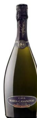
Gran Reserva BN Macabeu, Xarel·lo Parellada Chardonnay, Pinot Noir 30 mesos criaça