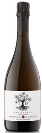
Ancestral Escumós Clàssic Penedès Xarel·lo Vermell 15 mesos