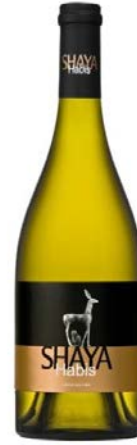
Shaya Habis Verdejo vinya vella 7 meses barrica