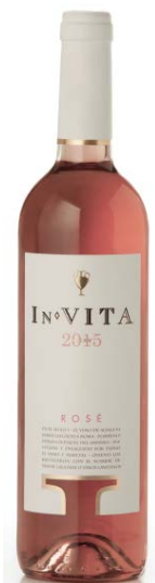
In Vita Garnatxa Syrah