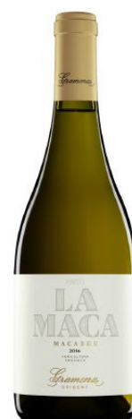
La Maca 100% Macabeo (Biodinàmic)