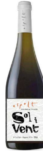
Sol i Vent ecològic Macabeu Garnatxa blanca i grisa