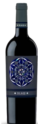
Blau 50% Carinyena, 25% Garnatxa 25% Syrah 4 mesos barrica