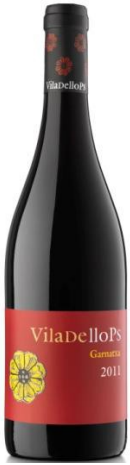
Viladellops Negre Garnatxa 6 mesos en tina ecològic