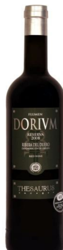
Dorium Reserva Tempranillo Vinya vella 18 meses barrica