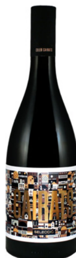
Cairats Selecció Samsó, Garnatxa 12 mesos barrica