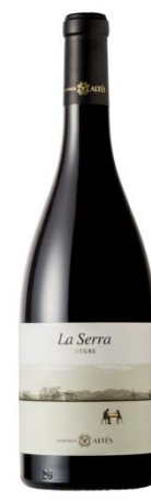
La Serra 80% Samsó 20% Garnatxa negra vinya vella 12 mesos barrica