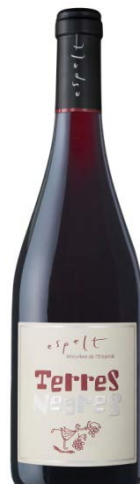
Terres Negres Samsó i Garnatxa 12 mesos barrica Bot. 75cl / 150cl