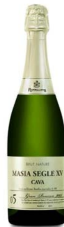
Masia S.XV Xarel-lo , Macabeu Parellada, Chardonnay 6 anys criaça