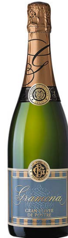
Gran Cuvée de postre Gran Reserva dolç Xarel·lo, Macabeu, Parellada 30 mesos criaçça