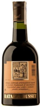
Ratafia Russet Maceració durant 9 mesos d' herbes, espècies i fruits, especialment les nous verdes en aiguardent o alcohol