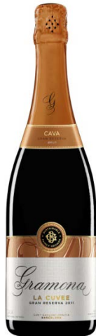
La Cuvée Brut Gran Reserva Xarel·lo, Macabeu 36 mesos criaçça