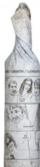
Licorella Garnatxa 6 mesos barrica