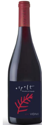
Vidiví Garnatxa i Merlot 12 mesos barrica Bot. 75cl / 50cl / 150cl