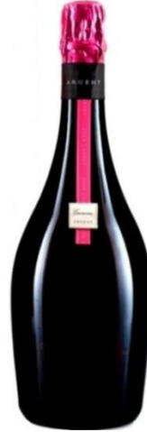
Argent Rosé Gran Reserva Brut Nature Pinot Noir 30 mesos criaçça