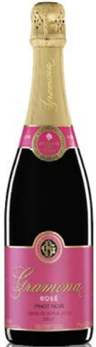
Rosat Pinot Noir Pinot Noir 24 mesos criaçça