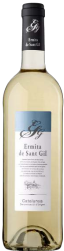
Ermita S. Gil Blanc Macabeu, Garnatxa B.