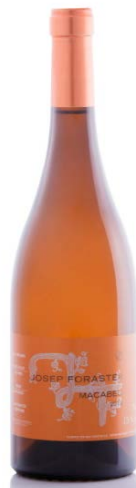
Josep Foraster Macabeu 100% Macabeu