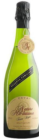
Natura Mil·lessima Reserva Familiar Macabeu, Xarel·lo, Parellada 30 mesos criaença