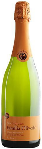
Familia Oliveda Brut Jove Macabeu, Xarel·lo, Parellada 12 mesos criaença