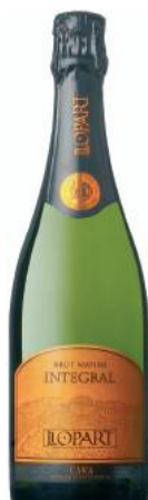
Integral B.Nature Parellada, Chardonnay Xarel-lo 18 mesos criaça