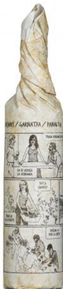
Panal Garnatxa 6 mesos barrica