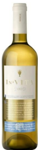
In Vita Pansa Blanca (Xarel·lo) Sauvignon Blanc 6 mesos sobre lies