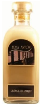
Crema de Orujo