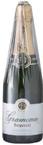
Imperial Brut Gran Reserva Xarel·lo, Macabeu, Chardonnay 3/4 anys criaçça Bot. 75cl / 150cl