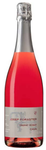
Cava Trepat Rosat 100% Trepat