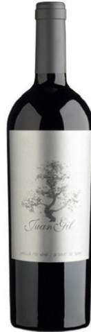
Juan Gil Etiqueta plata Monastrell Vinya vella 12 mesos barrica