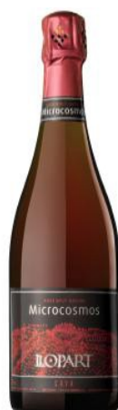
Microcosmos 85% Pinot noir 15% Monastrell 24 mesos criaça