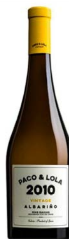
Paco & Lola Vintage Albariño