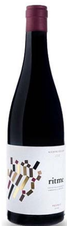
Ritme Carinyena Garnatxa peluda Garnatxa 10 mesos barrica nova