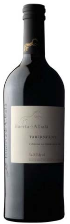
Taberner N1 Syrah