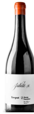
Julieta Trepat 100% Trepat