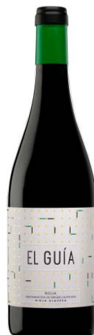
El Guía Tempranillo 95% Viura 5%