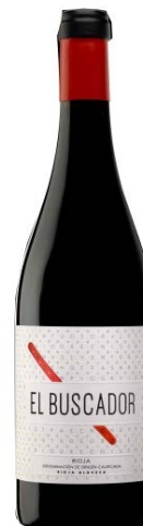
El Buscador Tempranillo 90% Garnacha 10% 12 meses barrica