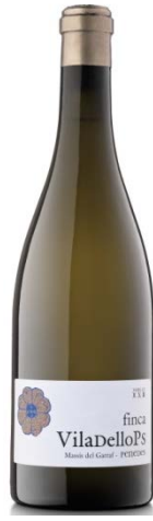
Finca Blanc Xarel·lo de 3 parcel·les 8 mesos barrica ecològic