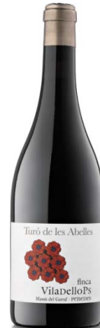
Turó de les Abelles 50% Garnatxa 50% Syrah 24 mesos barrica ecològic