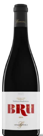
Bru Pinot Noir Pinot noir 8 mesos barrica (Biodinàmic)