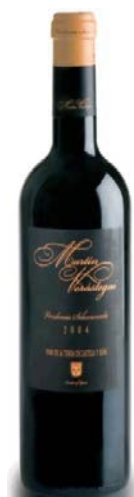
Martín Verástegui 75% Tempranillo 25% Garnacha 18 mesos barrica