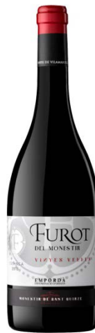
Furot del Monestir Samsó de vinya vella 15 mesos barrica