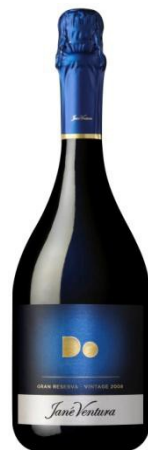
Gran Reserva "DO" 60% Xarel·lo, 26% Macabeu 14% Parellada 45 mesos criança