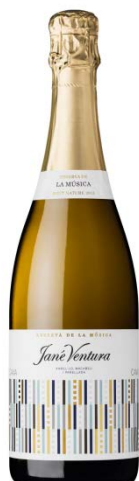
Rva. de la Música BN Xarel·lo, Macabeu, Perellada 24-30 mesos criança