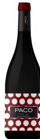
Paco (d.o. Valdeorras) 100% Mencía