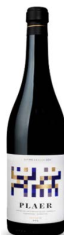
Plaer 80% Carinyena vinya vella 20% Garnatxa 12 mesos barrica