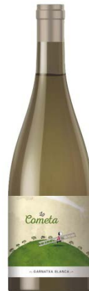
Lo Cometa Blanc Garnatxa