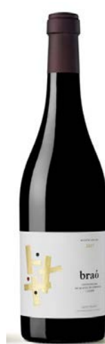
Braó Carinyena (Samsó) Garnatxa negra 13 mesos barrica