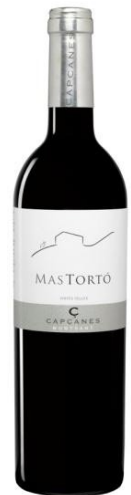
Mas Tortó Garnatxa, Syrah 12 mesos barrica (ecològic)