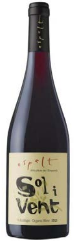
Sol i Vent ecològic Lledoner Negre, Monastrell i Syrah