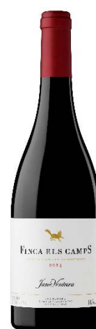
Finca Els Camps 95% Cabernet 5% Sumoll 13 mesos barrica