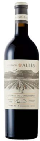
Lo Grau 100% Garnatxa