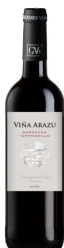
Viña Arazu Negre Tempranillo Garnatxa