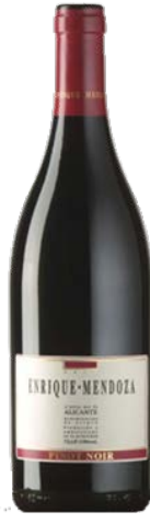
Pinot Noir Pinot Noir 10 mesos barrica