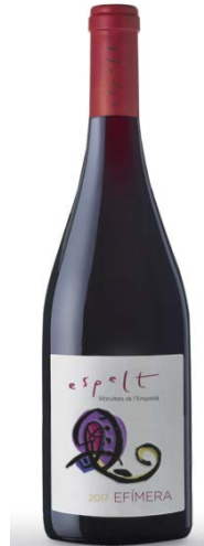
Efimera ecològic Garnatxa Maceració carbonica