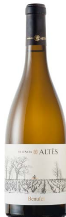
Benufet 100% Garnatxa blanca criança sobre lies