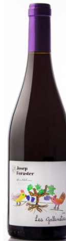
Les Gallinetes 70% Garnatxa Negra 30% Syrah