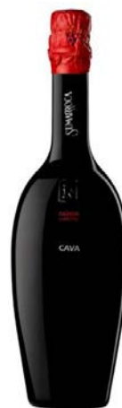
Núria Claverol Xarel·lo 24-36 mesos criança