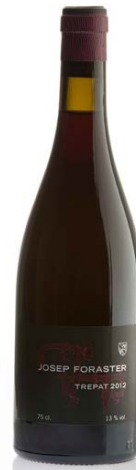
Josep Foraster Trepat 100% Trepat