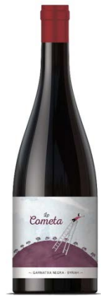
Lo Cometa Negre Garnatxa/Syrah