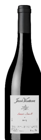
Jané Ventura Somoll 100% Somoll