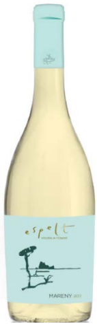
Mareny Garnatxa Blanca Sauvignon Blanc