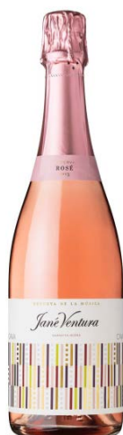
Rva. de la Música Rosé Garnatxa Negra 18-24 mesos criança