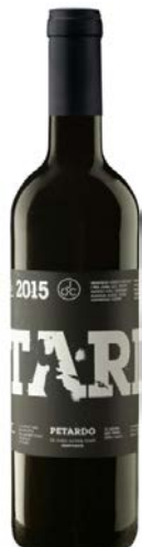
Petardo 50% Garnatxa, 25% Cabernet Franc 13% Merlot, 12% Samsó