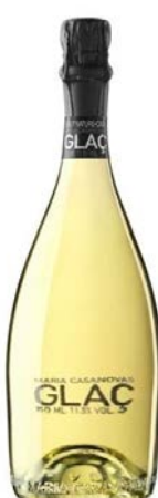
Glaç Pinot Noir, Macabeu Xarel·lo, Parellada 18 mesos criaça Bot. 37,5cl / 75cl