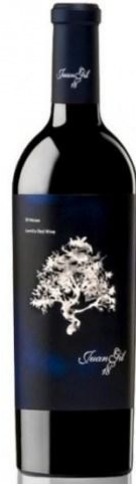
Juan Gil Azul Monastrell, Syrah, Cabernet S. 18 mesos barrica