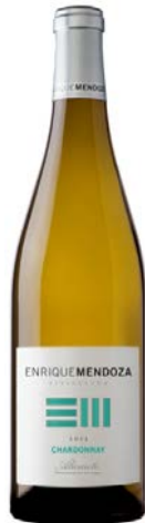
Chardonnay Joven Chardonnay