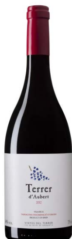
Terrer d'Aubert 80% Cabernet Sauvignon 20% Garnatxa negra 12 mesos barrica