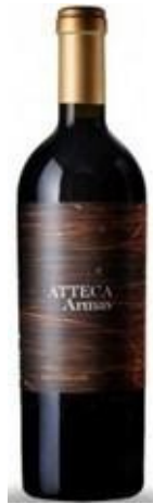
Atteca Armas Garnacha Vinya vella 18 mesos barrica