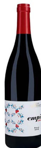
Empit Selecció 95% Carinyena 5% Garnatxa Negra Vinya de + 80 anys 14 mesos barrica