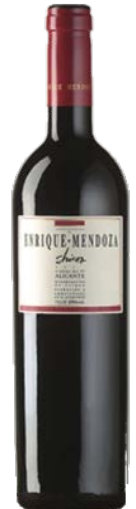
Shiraz crianza 13 mesos barrica