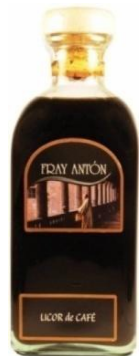
Orujo de café