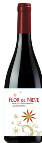
Flor de Nieve Merlot, Tempranillo