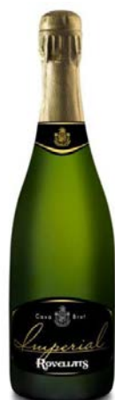
Imperial Brut Macabeu , Parellada Xarel-lo 24/30 mesos criaça Bot. 37,5cl/75cl