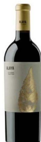
Alaya Garnacha Tintorera 15 mesos barrica