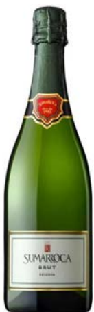
Brut Reserva Macabeu, Xarel·lo Parellada, Chardonnay 24 mesos criança