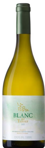
Blanc del Terrer 100% Macabeu 6 mesos Inox. sobre lies