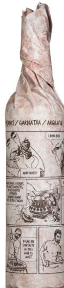
Argila Garnatxa 6 mesos barrica