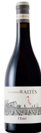
L'Estel 80% Garnatxa 20% Syrah 3 mesos barrica