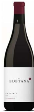
Edetana Negre Garnatxa fina Garnatxa peluda, Samsó 12 mesos barrica