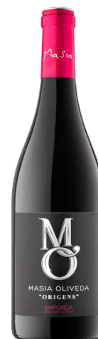
Mo Origenes Garnatxa, Samsó 6 mesos barrica