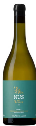
Nus del terrer Blanc 100% Sauvignon Blanc 10 mesos en àmfora, barrica i inoxidable.