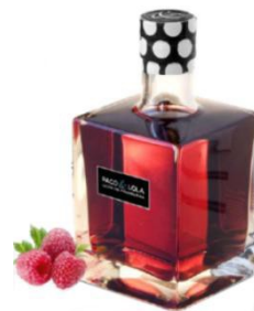
Licor de frambuesa Orujo de albariño frambuesa macerat 3 mesos