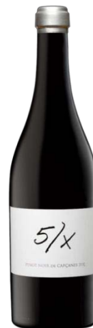
Pinot Noir – d.o. Catalunya Pinot Noir 11 mesos barrica