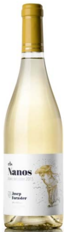
Els Nanos 100% Macabeu