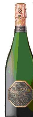
Ex Vite B GR 60% Xarel-lo 40%Macabeu 60 mesos criaça