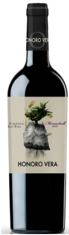
Honoro Vera (Ecológic) Orgànic Monastrell