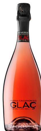
Glaç Rosat B N Macabeu, Parellada Xarel·lo, Pinot Noir 18 mesos criaça