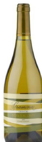
Mas Escorpí Chardonnay (ecològic)