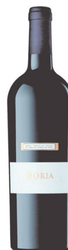
Bòria Syrah, Merlot Cabernet Sauvignon 12 mesos barrica