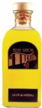
Orujo de hierbas