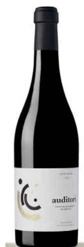
Auditori Garnatxa negra 13 mesos barrica