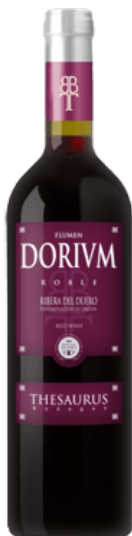
Dorium Roble Tempranillo 4 meses barrica