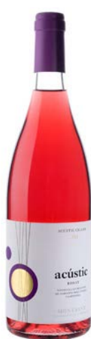
Acústic Rosat Garnatxa negra Garnatxa gris Carinyena (Samsó) Fermentat en barrica