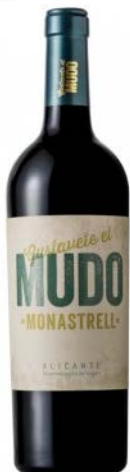
El Mudo 100% Monastrell