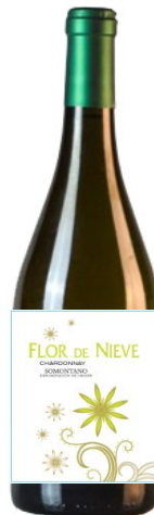
Flor de Nieve Chardonnay