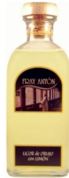
Orujo de Limón