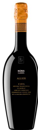
Allier Chardonnay 36 mesos criança