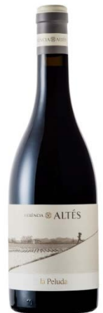
La Peluda 100% Garnatxa peluda