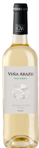
Viña Arazu Blanc Macabeu