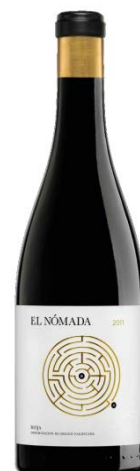
El Nómada Tempranillo 90% Graciano 10% 14 meses barrica