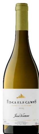
Finca Els Camps Macabeu i Malvasia Fermentat en barrica 5 mesos criança