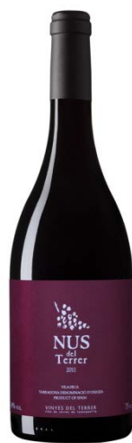
Nus del Terrer 85% Garnatxa 15% Cabernet S. 12 mesos barrica