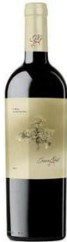
Juan Gil Etiqueta amarilla Monastrell 4 mesos barrica