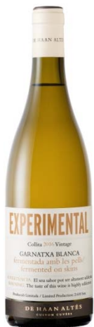
Experimental Blanc 100% Garnatxa blanca