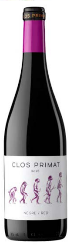
Clos Primat Negre Tempranillo, Garnatxa Cabernet Sauvignon