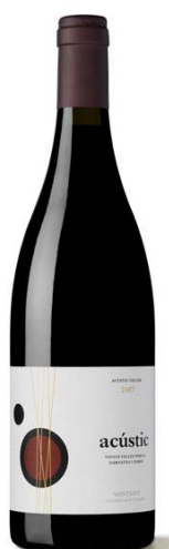
Acústic Negre Garnatxa Carinyena (Samsó) 13 mesos barrica