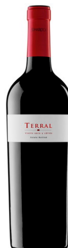
Terral Cabernet Franc, Syrah Merlot, Cabernet Sauvignon 12 mesos barrica