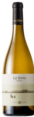
La Serra 100% Garnatxa blanca 12 mesos criança