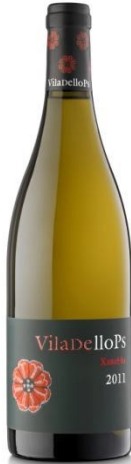
Viladellops Blanc Xarel·lo ecològic