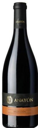
Anayón Selección Tempranillo Cabernet Sauvignon, Syrah 11 meses barrica