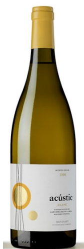
Acústic Blanc Garnatxa blanca Macabeu, Garnatxa Gris Xarel·lo Fermentat en barrica