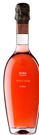
Rosat Pinot Noir 16 mesos criança