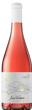
Vinyes Roses Ull de llebre, Sumoll Merlot, Syrah