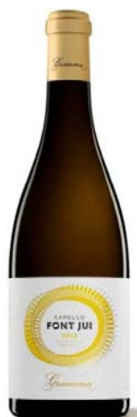
Font Jui Xarel·lo (ecològic) Fermentat i criat en barrica (Biodinàmic)