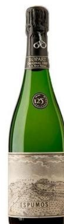
Original 1887 G. Rva. Brut Nature Montónega, Xarel-lo Macabeu 60 mesos criaça