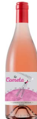
Lo Cometa Rosat Garnatxa Negre