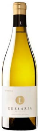
Edetària Blanc 100% Garnatxa blanca 8 mesos criaça