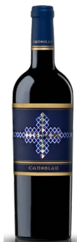
Can Blau 40% Carinyena, 40% Syrah 20% Garnatxa 12 mesos barrica