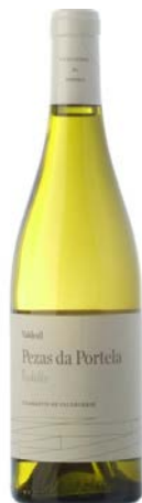
Pezas da Portela Godello fermentat en barrica