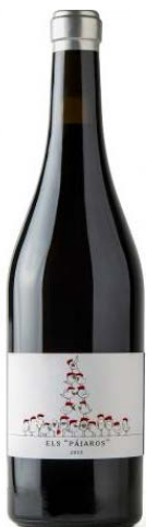
Els Pajaros 100% Samsó Vinyes Velles de 75 a 110 anys 12 mesos barrica