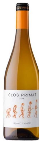
Clos Primat Blanc Macabeu, Garnatxa Blanca, Sauvignon Blanc