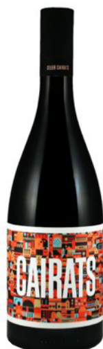
Cairats Garnatxa, Samsó Ull de llebre 3 mesos barrica