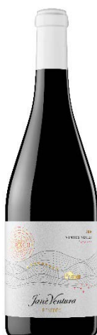
Vinyes Negres Merlot, Ull de llebre, Sumoll Cabernet, Syrah 8 mesos barrica