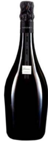
Argent Gran Reserva Chardonnay 3/4 anys criaçça