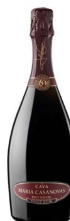
Rosat Pinot Noir Pinot Noir 12 mesos criaça