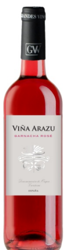
Viña Arazu Rosat Garnatxa