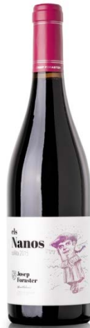
Els Nanos 90% Ull de Llebre 10% Cabernet Sauvignon