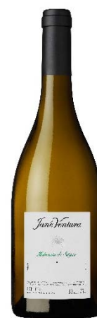
Malvasia Malvasia de Sitges Fermentat en barrica 4 mesos criança amb lies