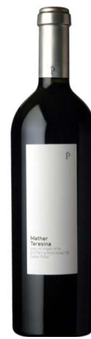
Mather Teresina 40% Garnatxa 30% Carinyena 30% Morenillo 20 mesos barrica