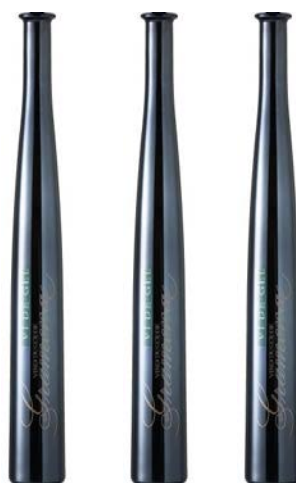
Vi de Glass (dolç) 1· Riesling 2· Gewürztraminer 3· Xarel·lo