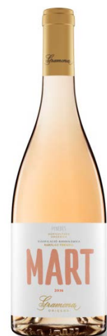
Mart 100% Xarel·lo vermell (Biodinàmic)