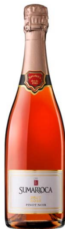
Brut Rosé Pinot Noir 14 mesos criança