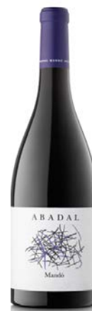
Mandó 100% Mandó