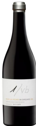
1/Vb (Blanc de negres) Garnatxa Vinyes Velles 36 mesos barrica