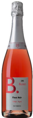
Brut Rosat 100% Pinot Noir 15 mesos criança