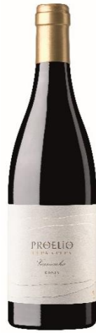
Cepa a Cepa Garnatxa 100% Garnacha 15 meses tina 4000 lt.