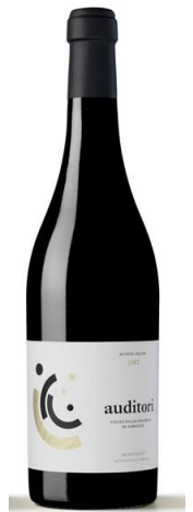
Auditori Garnatxa negra 13 mesos barrica