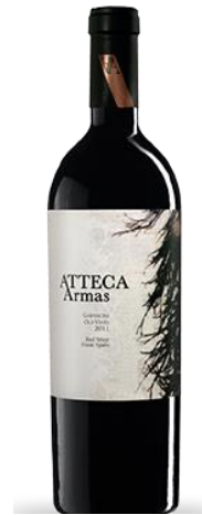
Atteca Armas Garnacha Vinya vella 18 mesos barrica