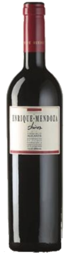
Shiraz crianza Shiraz 13 meses barrica