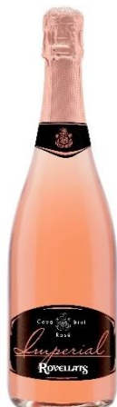
Imperial Rosé Monastrell, Garnatxa 24 mesos criança