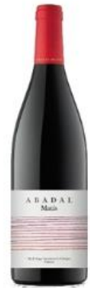
Matis Mandó, Merlot Cabernet Sauvignon, 10 mesos barrica