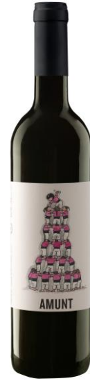
Amunt 100% Syrah, Monastrell Pas per barrica