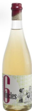
6 Vincles Pansa blanca