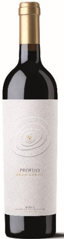
Cepa a Cepa 100% Tempranillo 17 meses barrica.