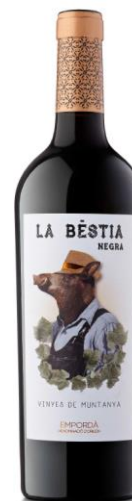
La Bestia Negra 80% Garnatxa 20% Cabernet Sauvignon Vinyes de Muntanya