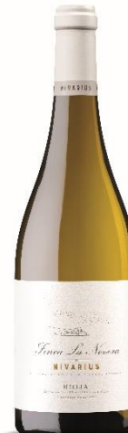
Finca la Nevera 100% Maturana blanca