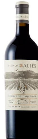
Lo Grau 90% Syrah 10% Garnatxa 10 mesos barrica