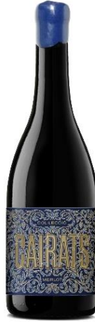
Cairats Col·lecció Merlot