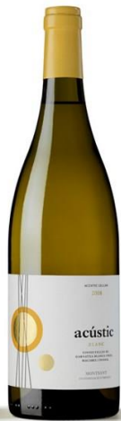
Acústic Blanc Garnatxa blanca i gris Macabeu, Xarel·lo Fermentat en barrica