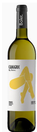
Camagroc Xarel·lo 100%