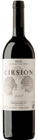
Cirsión Tempranillo 8 meses barrica 75cl/150cl/300cl