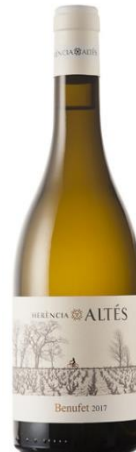
Benufet 100% Garnatxa blanca criança sobre lies