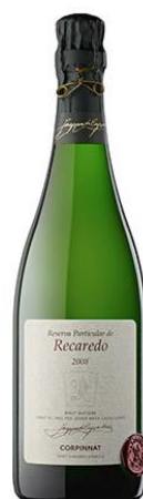
Reserva Particular BN Xarel·lo i Macabeu