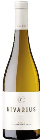
Nivarius 95% Tempranillo blanco 5% Malvasía