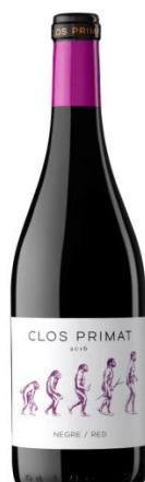
Clos Primat Negre Ull de Llebre, Garnatxa Cabernet Sauvignon