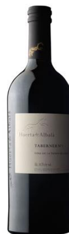
Taberner N1 Syrah 24 mesos barrica