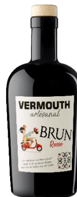
Brun Vermouth Artesanal Brun Rosso