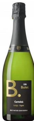
Cartoixà G.R.v. 100% Xarel·lo 100 mesos criança