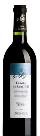
Ermita S. Gil Negre Garnatxa, Samsó