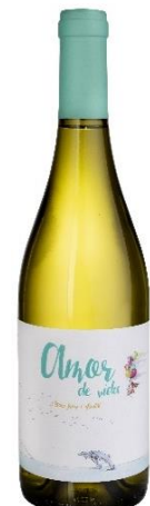
Amor de vida Macabeu i Parellada