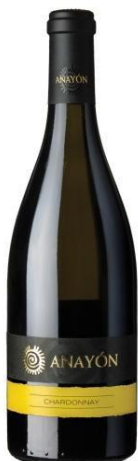
Anayón Chardonnay Chardonnay 6 mesos barrica