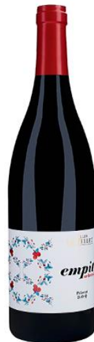
Empit Selecció 95% Carinyena 5% Garnatxa Negra Vinya de + 80 anys 14 mesos barrica