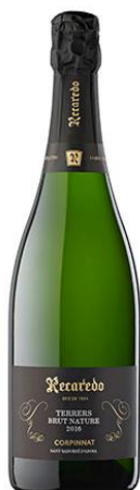
Terrers BN Xarel·lo, Macabeu Monastrell i Parellada Llarga criaça