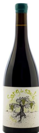
Sang de Sauló Mica Merlot