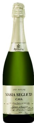
Masia S.XV Xarel·lo , Macabeu Parellada, Chardonnay 6 anys criança