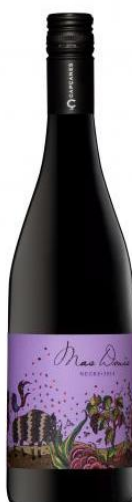
Mas Donís Negre Ull de Llebre, Garnatxa Merlot, Syrah, Samsó