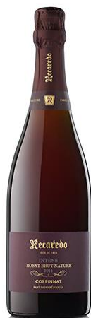
Intens Rosat BN Monastrell Garnatxa Llarga criaça