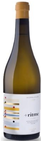
+Ritme Garnatxa Macabeu 3 mesos barrica 11 mesos sobre lies