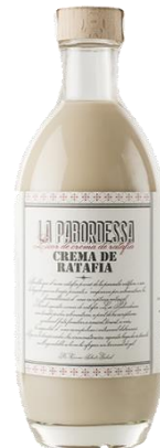
Crema de Ratafia