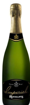
Imperial Brut Macabeu , Parellada Xarel·lo 24/30 mesos criança Bot. 37,5cl/75cl