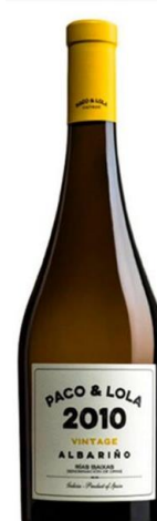
Paco & Lola Vintage Albariño