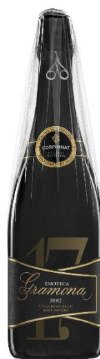
Enoteca Brut Nature Gran Reserva Brut Nature Xarel·lo, Macabeu 12 anys criaça