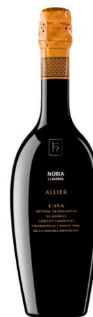
Allier Chardonnay 36 mesos criança