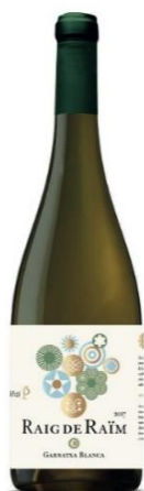
Raig de Raim Garnatxa Blanca Macabeu