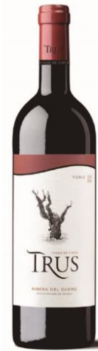
Trus Roble 100% Tempranillo. 4 meses barrica.