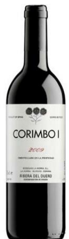
Corimbo I Tinta del País 14 meses barrica