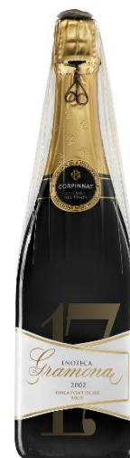
Enoteca Brut Gran Reserva Brut Xarel·lo, Macabeu 12 anys de criaça