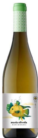
Mo Blanc Macabeu, Muscat Chardonnay