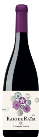
Raig de Raim Negre Cupatge