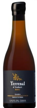
Terrenal Ranci Reposat en damajoana i barrica amb mares de + 30 anys.