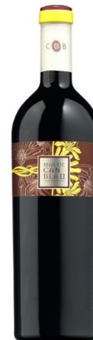
Mas de Can Blau Carinyena, Syrah Garnatxa 18 mesos barrica