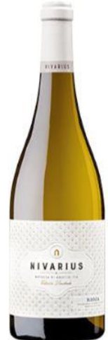
Nivarius Ed. Limitada