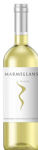
Marmellans Blanc D.O Catalunya Macabeu Garnatxa blanca