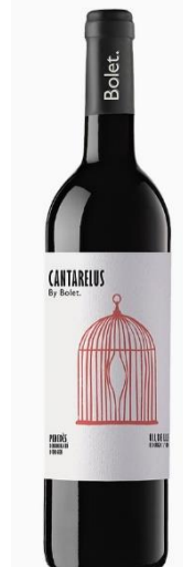
Cantareus Ull de llebre 3 mesos barrica