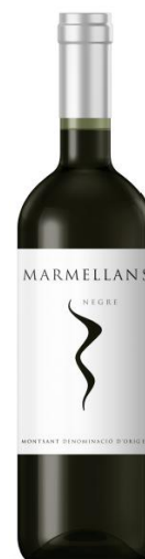
Marmellans Negre D.O Catalunya Samsó Ull de Llebre Garnatxa