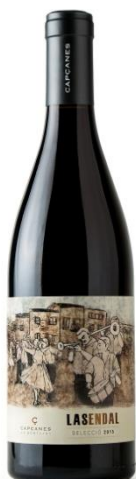
Lasendal 90% Garnatxa 10% Syrah 9 mesos barrica