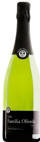
Familia Oliveda BN Reserva Macabeu, Xarel·lo 18 mesos criança