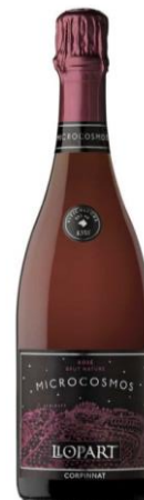
Microcosmos 85% Pinot noir 15% Monastrell 24 mesos criaça Ecològic