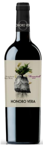
Honoro Vera (Ecològic) Orgànic Monastrell