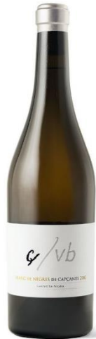
Ç/Vb (Blanc de negres) Garnatxa Vinyes Velles 36 mesos barrica