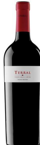
Terral Cabernet Franc, Syrah Merlot, Cabernet Sauvignon 12 mesos barrica