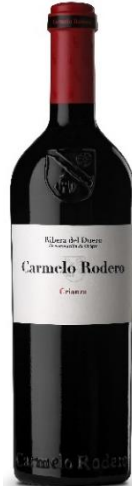
Crianza 90% Tinta del País 10% Cabernet S. 15 meses barrica