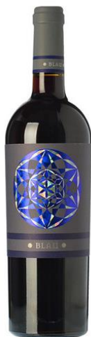
Blau Carinyena, Garnatxa Syrah 4 mesos barrica