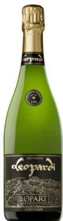
Leopardi B.N. Macabeu, Xarel·lo, Parellada, Chardonnay 64 mesos criaça