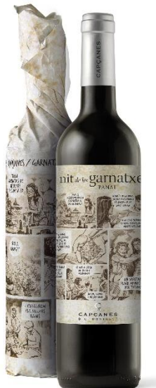
Panal Garnatxa 6 mesos barrica