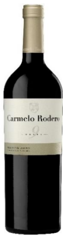
9 Meses 100% Tinta del País 9 meses barrica

Carmelo Rodero uva, ciencia, vino y arte