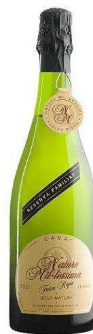
Natura Mil·lessima Reserva Familiar BN Macabeu, Xarel·lo, Parellada 30 mesos criança