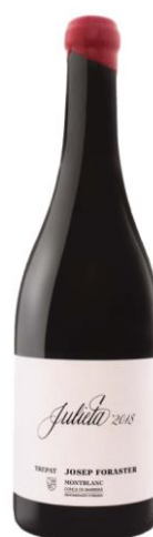
Julieta Trepát 100% Trepát