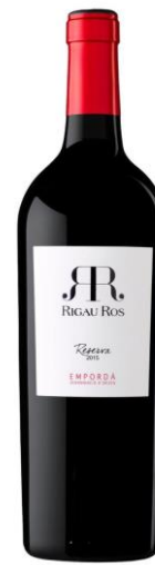
Rigau Ros Reserva 15 Garnatxa, Cabernet Sauvignon i Merlot 12 mesos bota 24 mesos ampolla