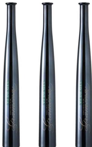
Vi de Glass (dolç) 1-Riesling 2-Gewürztraminer 3-Xarel·lo