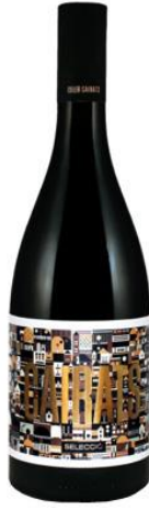
Cairats Selecció Samsó, Garnatxa 12 mesos barrica