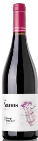
Els Nanos 90% Ull de Llebre 10% Cabernet Sauvignon