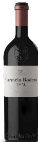
TSM 75% Tinta del país 10% Cabernet S. 15% Merlot 18 meses barrica Vinya vella