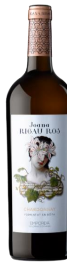
Joana Rigau Ros Reserva 100% Chardonnay Fermentat en bota