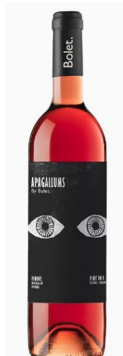
Apagallums Pinot Noir 100%