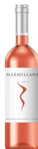
Marmellans Rosat D.O Catalunya Garnatxa Ull de Llebre Samsó