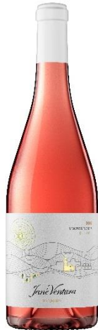
Vinyes Roses Ull de llebre, Sumoll Merlot, Syrah