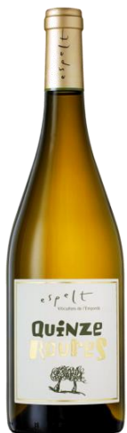
Quinze Roures Garnatxa Gris i Blanca Fermentat en barrica 3 mesos criaça