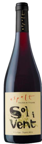
Sol i Vent Ecològic Lledoner Negre, Monastrell i Syrah