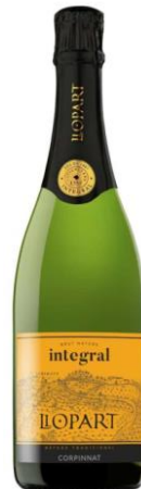
Integral B.Nature Parellada, Chardonnay Xarel·lo 24 mesos criaça Ecològic