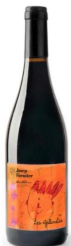
Les Gallinetes Garnatxa Negra Syrah i Trepát