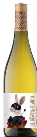
La Bestia Blanca 100% Garnatxa Blanca Vinyes de Muntanya