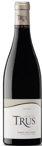
Trus Crianza 100% Tempranillo 12 meses barrica.