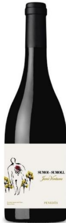
Sumoll 100% Sumoll 12 mesos barrica