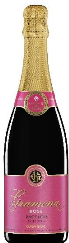
Rosat Pinot Noir Pinot Noir 24 mesos criaça