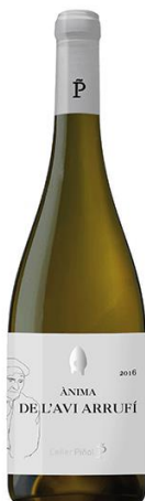
Ànima de l'Avi Arrufi 100% Garnatxa Blanca Vinyes velles