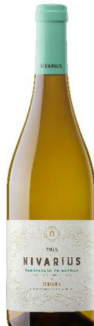
Fermentado en Barrica 65% Viura 15% Maturana blanca 10% Tempranillo blanco 10% Garnacha blanca.