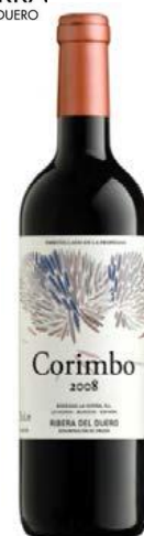
Corimbo Tinta del País 12 meses barrica