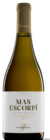
Mas Escorpí Chardonnay (Biodinàmic)