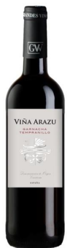
Viña Arazu Negre Tempranillo Garnatxa