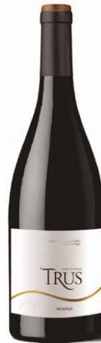
Trus Reserva 100% Tempranillo. 16 meses barrica.