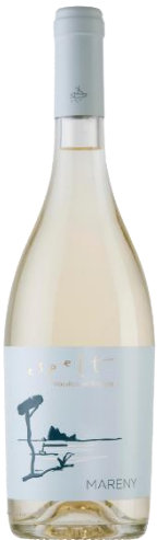
Mareny Garnatxa Blanca Sauvignon Blanc