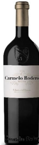
Reserva 90% Tinta del País 10% Cabernet S.