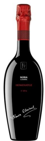
Núria Claverol Homenatge Xarel·lo 24-36 mesos criança