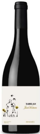
Xarel·lo 4 mesos criança barrica i anfora