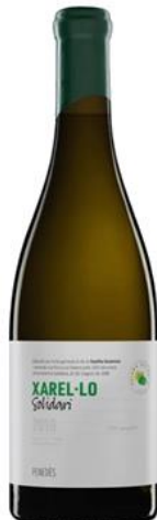
Solidari Xarel·lo Fermentat i criat en barrica (Biodinàmic)