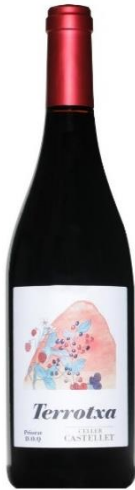
Terrotxa Garnatxa negra i peluda Cabernet Syrah i Merlot 12 mesos barrica