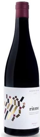
Ritme Carinyena Garnatxa peluda Garnatxa 10 mesos barrica nova