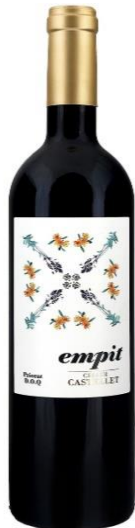
Empit Garnatxa negra i peluda Cabernet Sauvignon Carinyena de vinya vella 12 mesos barrica