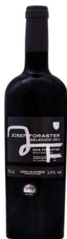
Josep Foraster Selecció 50% Cabernet Sauvignon 50% Garnatxa Negra