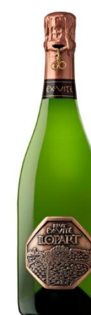
Ex Vite Brut Xarel·lo 60% Macabeu 40% 96 mesos criaça