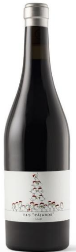
Els Pajaros 100% Samsó Vinyes Velles de 75 a 110 anys 12 mesos barrica