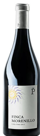
Finca Morenillo 100% Morenillo Vinyes velles