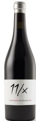
Pinot Noir - d.o. Catalunya Pinot Noir 11 mesos barrica