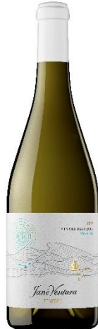
Vinyes Blanques Xarel·lo, Macabeu Malvasia, Garnatxa 3 mesos criança amb lies