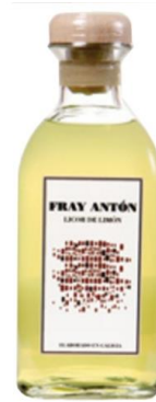
Orujo de Limón