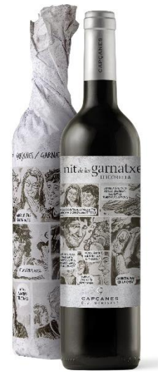
Licorella Garnatxa 6 mesos barrica