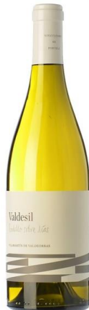
Valdesil Godello sobre líes