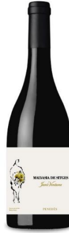
Malvasia Malvasia de Sitges Fermentat en barrica 4 mesos criança amb lies