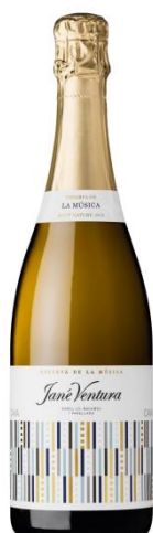
Rva. de la Música BN Xarel·lo, Macabeu, Perellada 24-30 mesos criança