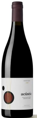
Acústic Negre Garnatxa, Samsó 13 mesos barrica