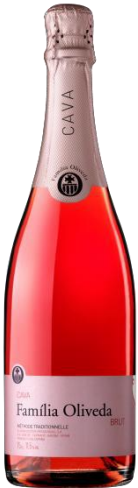
Familia Oliveda Rosat Brut Garnatxa i Pinot Noir 15 mesos criança