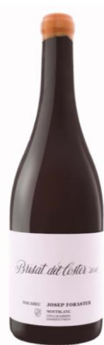
Josep Foraster Macabeu 100% Macabeu