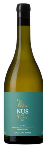
Nus del terrer Blanc 100% Sauvignon Blanc 10 mesos en àmfora, barrica i inoxidable.