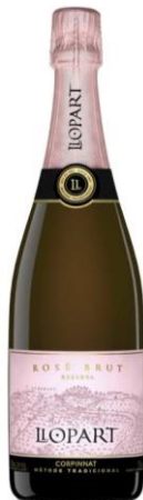
Brut Rosé Monastrell Garnatxa, Pinot Noir 20 mesos criaça Ecològic