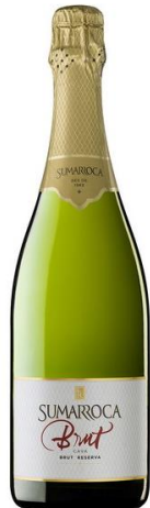
Brut Reserva Macabeu, Xarel·lo, Parellada, Chardonnay 24 mesos criança