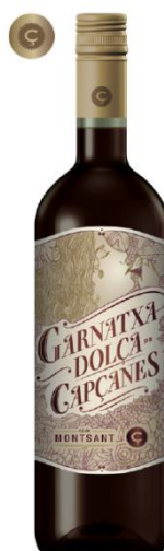
Garnatxa (dolça) Vi de licor 36 mesos