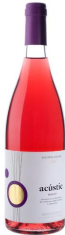
Acústic Rosat Garnatxa negra i gris Samsó Fermentat en barrica