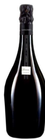
Argent Gran Reserva Chardonnay 3/4 anys criaça