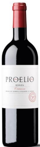
Crianza 90% Tempranillo 10% Garnacha. 12 meses barrica.