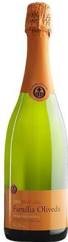
Familia Oliveda Brut Jove Macabeu, Xarel·lo, Parellada 12 mesos criança