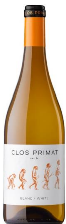
Clos Primat Blanc Macabeu, Garnatxa Sauvignon Blanc