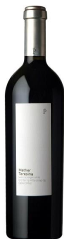
Mather Teresina 40% Garnatxa 30% Carinyena 30% Morenillo 20 mesos barrica