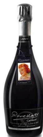
Colecció GR Cartells i Plaques modernistes Xarel·lo, Parellada