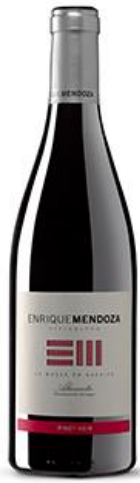
Pinot Noir Pinot Noir 10 meses barrica