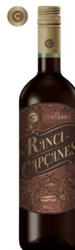
Ranci Garnatxa Vi de licor 36 mesos