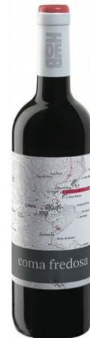
Coma Fredosa 67% Cabernet Sauvignon 33% Garnatxa Negra 11 mesos en barrica