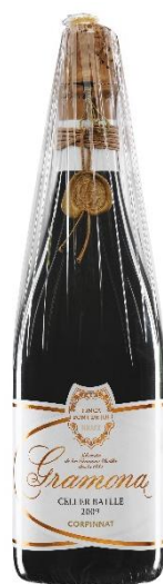
Celler Batlle Gran Reserva Brut Xarel·lo, Macabeu + 8 anys criaça