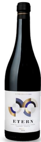
Etern 80% Carinyena vinya vella 20% Garnatxa 12 mesos barrica

VINYES DEL TERRER vins de terres de lumaquella