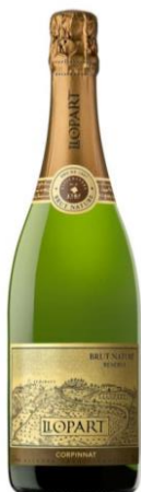
Brut Nature Macabeu, Xarel·lo, Parellada, Chardonnay 30 mesos criaça Ecològic