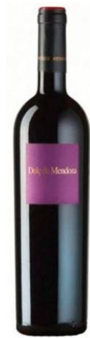
Dolç de Mendoza Sobre maduració en la planta