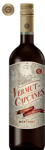
Vermut Garnatxa blanca i Macabeu