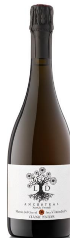
Ancestral Escumós Clàssic Penedès Xarel·lo Vermell 15 mesos