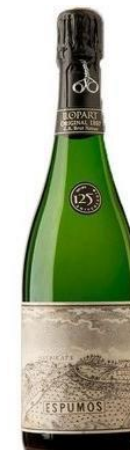
Original 1887 B.N. Montònega, Xarel·lo Macabeu 60 mesos criaça