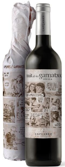
Argila Garnatxa 6 mesos barrica