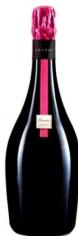
Argent Rosé Gran Reserva Brut Nature Pinot Noir 30 mesos criaça