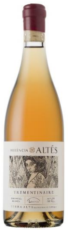
Trementinaire Garnatxa blanca vinyes velles 22 m. Criança oxidativa