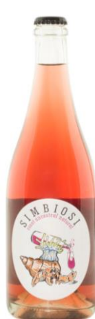
Simbiosi (escumós) Cabernet, Garnatxa Pansa blanca i Pansa roja