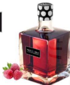
Licor de frambuesa Orujo de albariño frambuesa macerat 3 mesos