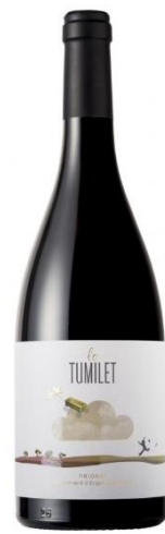
Lo Tumilet 100% Garnatxa negra 12 mesos barrica