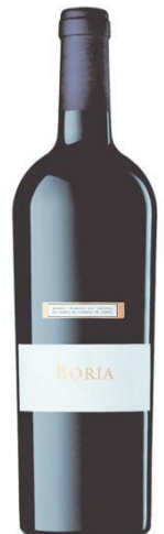
Bòria Syrah, Merlot Cabernet Sauvignon 12 mesos barrica