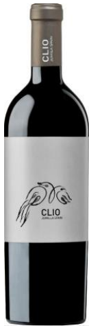
Clio 70% Monastrell 30% Cabernet Sauvignon 22-26 mesos barrica