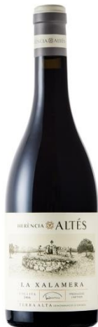
La Xalamera 100% Garnatxa negra 6 mesos fudre