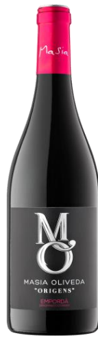
Mo Origenes Garnatxa, Samsó 6 mesos barrica