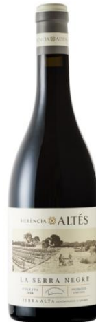
La Serra 80% Samsó 20% Garnatxa negra vinya vella 12 mesos barrica