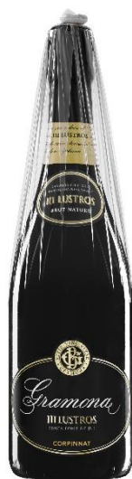
III Lusters Gran Reserva Brut Nature Xarel·lo, Macabeu + 5 anys criaça