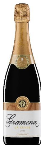
La Cuvée Brut Gran Reserva Xarel·lo, Macabeu 36 mesos criaça