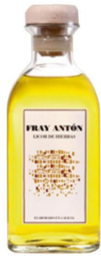
Orujo de hierbas