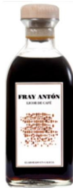
Orujo de café