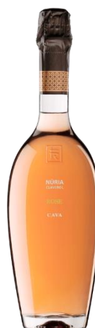
Rosat Pinot Noir 16 mesos criança