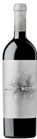
El Nido 70% Cabernet Sauvignon 30% Monastrell 22-26 mesos barrica