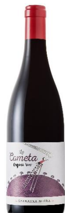
Lo Cometa Negre Ecològic Garnatxa, Syrah