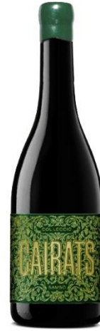
Cairats Col·lecció Samsó