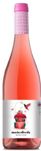
Mo Rosat Samsó, Garnatxa Cabernet Sauvignon