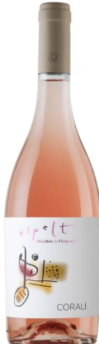
Corali Ecològic Garnatxa