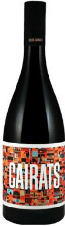
Cairats Garnatxa, Samsó Ull de Llebre 3 mesos barrica