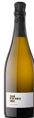
Turó d'en Mota 100% xarel·lo Mínim 120 mesos criaça