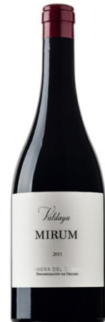
Valdaya Mirum Tinta del País 15 meses barrica