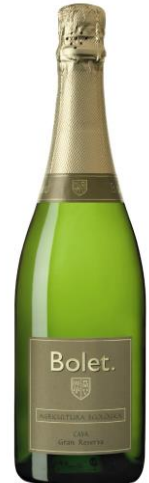
B N Gran Reserva Macabeu, Xarel·lo, Parellada 36 mesos criança