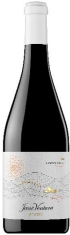
Vinyes Negres Merlot, Ull de llebre, Sumoll, Cabernet, Syrah 8 mesos barrica