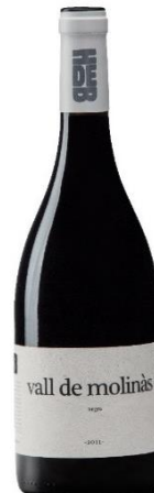
Vall de Molinàs 100% Garnatxa Vermella