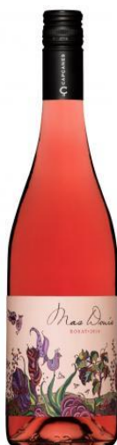
Mas Donís Rosat 80% Garnatxa negra Samsó, Syrah, Merlot