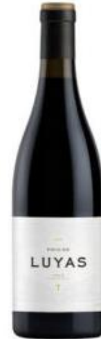
Pico de Luyas 100% Tempranillo. 15 meses barrica.

CONSEJO REGULADOR DE LA DENOMINACIÓN DE ORIGEN RIBERA DEL DUERO