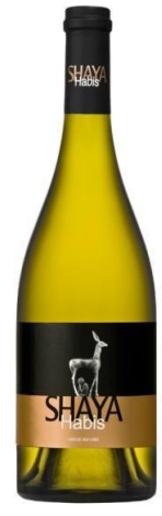
Shaya Habis Verdejo vinya vella 7 mesos barrica