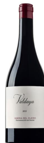
Valdaya Tinta del País 15 meses barrica