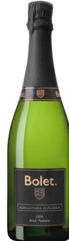
B N Reserva Macabeu, Xarel·lo, Parellada 24 mesos criança