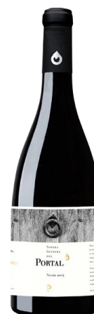
Portal 60% Garnatxa 15% Carinyena 10% Merlot 15% Syrah 12 mesos barrica