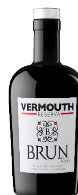
Brun Rv. Vermouth Reserva Brun Rosso