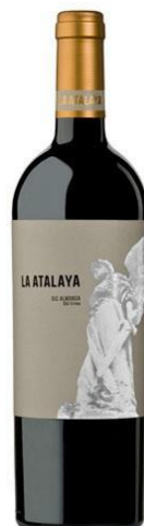
La Atalaya 85% Garnacha Tintorera 15% Monastrell 12 meses barrica