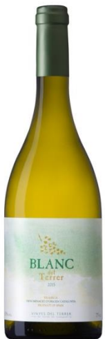
Blanc del Terrer 100% Macabeu 6 mesos sobre lies