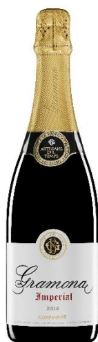
Imperial Brut Gran Reserva Xarel·lo, Macabeu, Chardonnay 3/4 anys criaça Bot. 75cl / 150cl