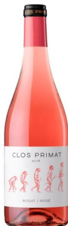
Clos Primat Rosat Garnatxa Ull de Llebre