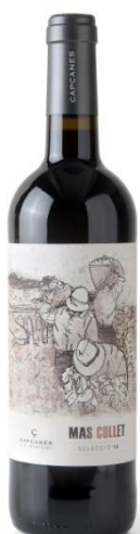
Mas Collet Garnatxa, Samsó Cabernet Sauvignon 9 mesos barrica Bot. 37,5cl / 75cl / 150cl