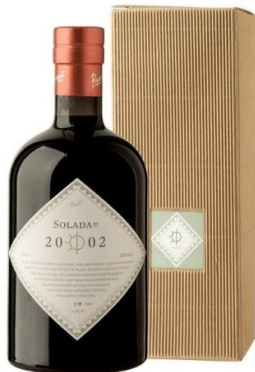
Solada Ratafia Rosset 15 anys