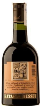
Ratafia Rosset Maceració durant 9 mesos d' herbes, espècies i fruits, especialment les nous verdes en aiguardent o alcohol