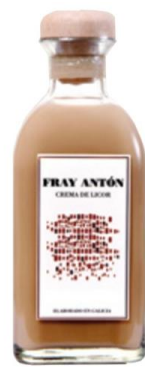
Crema de Orujo