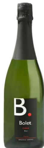
Brut Clàssic Macabeu, Xarel·lo, Parellada 12 mesos criança