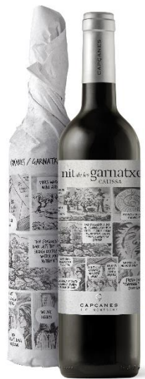
Calissa Garnatxa 6 mesos barrica