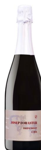
Cava Trepát Rosat 100% Trepát