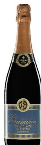
Gran Cuvée de postre Gran Reserva dolç Xarel·lo, Macabeu, Parellada 30 mesos criaça