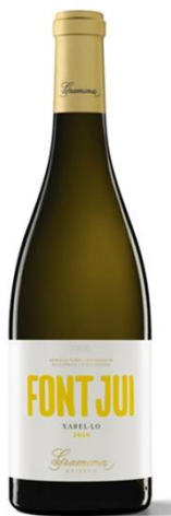
Font Jui Xarel·lo Fermentat i criat en barrica (Biodinàmic)