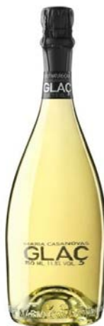
Glaç Pinot Noir, Macabeu Xarel·lo, Parellada 18 mesos criaça Bot. 37,5cl / 75cl