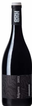
Falguera 60% Samsó 40% Garnatxa vermella 14 mesos barrica