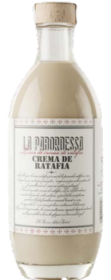
Crema de Ratafia