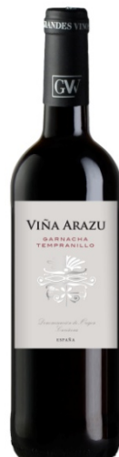
Viña Arazu Negre Tempranillo Garnatxa