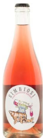
Simbiosi Cabernet, Garnatxa Pansa blanca i Pansa roja