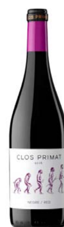
Clos Primat Negre Tempranillo ,Garnatxa Cabernet Sauvignon