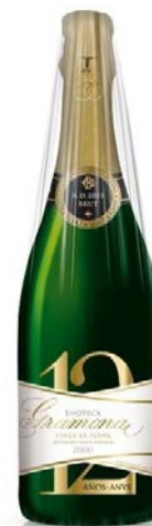
Enoteca Brut Gran Reserva Brut Xarel·lo, Macabeu 12 anys de criaçça