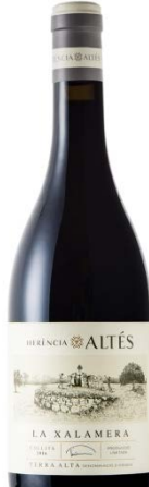
La Xalamera 100% Garnatxa negra