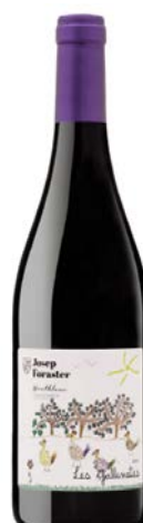
Les Gallinetes 70% Garnatxa Negra 30% Syrah