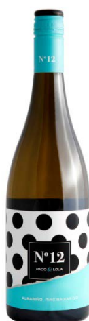
Nº 12 Albariño