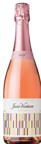
Rva. de la Música Rosé Garnatxa Negra 18-24 mesos criança