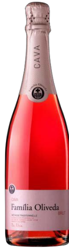
Familia Oliveda Rosat Brut Garnatxa i Pinot Noir 15 mesos criança