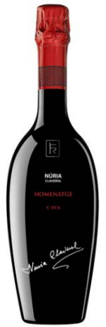
Núria Claverol Homenatge Xarel·lo 24-36 mesos criança