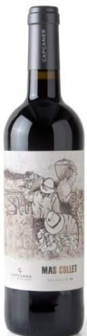
Mas Collet Garnatxa, Samsó Ull de Llebre, Cabernet S. 9 mesos barrica Bot. 37,5cl / 75cl / 150cl