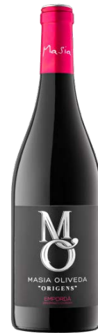
Mo Origenes Garnatxa, Samsó 6 mesos barrica