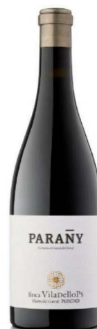
Parany Carinyena 100% Vinyes velles