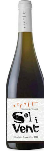
Sol i Vent ecològic Macabeu Garnatxa blanca i grisa