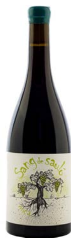
Sang de Sauló Mica Merlot