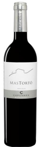
Mas Tortó Garnatxa, Syrah 12 mesos barrica (ecològic)