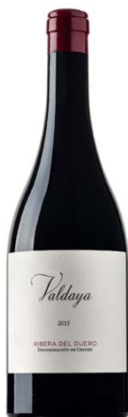
Valdaya Tempranillo 15 mesos barrica