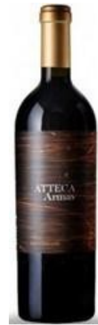
Atteca Armas Garnacha Vinya vella 18 mesos barrica