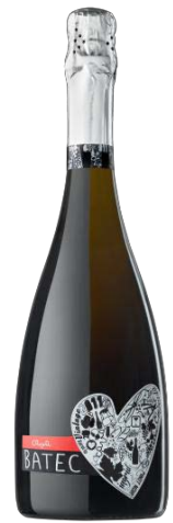
Batec Brut Gran reserva Pinot Noir i Xarel·lo 30 mesos criança