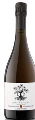
Ancestral Escumós Clàssic Penedès Xarel·lo Vermell 15 mesos