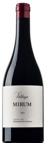
Valdaya Mirium Tempranillo 15 mesos barrica