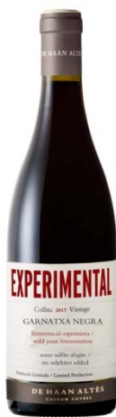
Experimental Negre 100% Garnatxa Negra