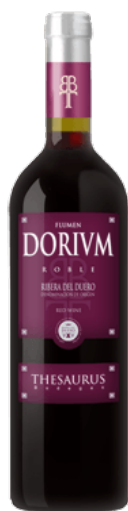
Dorium Roble Tempranillo 4 mesos barrica