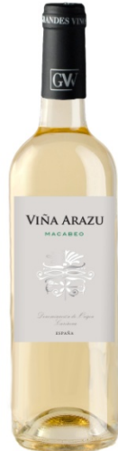
Viña Arazu Blanc Macabeu