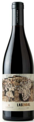
Lasendal Garnatxa Merlot, Syrah 9 mesos barrica