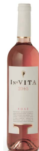
In Vita Garnatxa Syrah