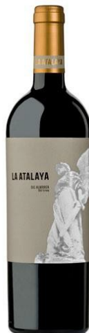
La Atalaya 85% Garnacha Tintorera 15% Monastrell 12 meses barrica