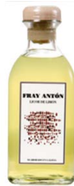
Orujo de Limon