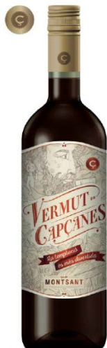
Vermut Garnatxa blanca i Macabeu