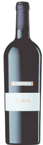
Bòria Syrah, Merlot Cabernet Sauvignon 12 mesos barrica