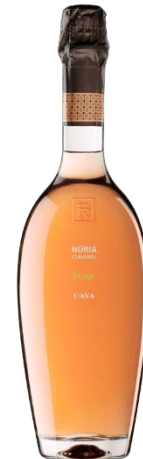
Rosat Pinot Noir 16 mesos criança