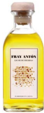
Orujo de hierbas