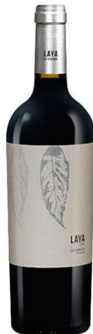
Laya 70% Garnacha Tintorera 30% Monastrell 4 meses barrica