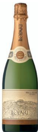
Brut Nature Macabeu, Xarel·lo, Parellada, Chardonnay 26 mesos criaça