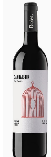
Cantarellus Ecològic Ull de llebre 3 mesos barrica