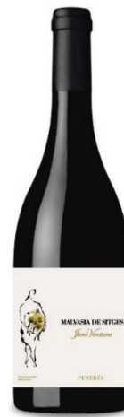
Malvasia Malvasia de Sitges Fermentat en barrica 4 mesos criança amb lies