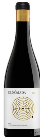
El Nómada Tempranillo 90% Graciano 10% 14 mesos barrica