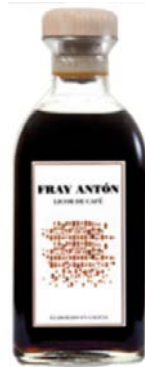
Orujo de café