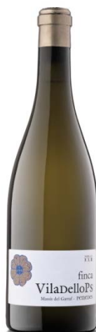
Finca Blanc Xarel·lo de 3 parcel·les 8 mesos barrica