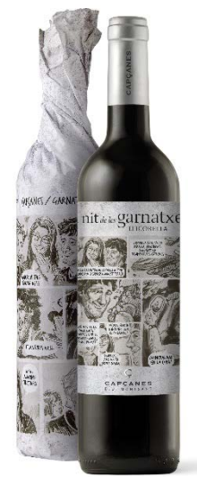
Licorella Garnatxa 6 mesos barrica