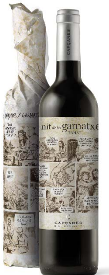
Panal Garnatxa 6 mesos barrica