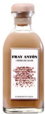
Crema de Orujo