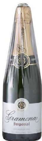
Imperial Brut Gran Reserva Xarel·lo, Macabeu, Chardonnay 3/4 anys criaçça Bot. 75cl / 150cl