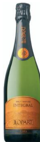
Integral B. Nature Parellada, Chardonnay Xarel·lo 18 mesos criaça