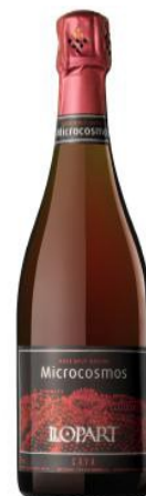
Microcosmos 85% Pinot noir 15% Monastrell 24 mesos criaça