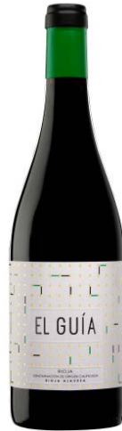
El Guía Tempranillo 95% Viura 5%