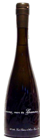
Marc de Cava

Orujo de albariño frambuesa macerat 3 mesos