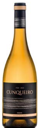
Cunqueiro Coupage de varietats del Ribeiro