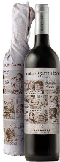
Argila Garnatxa 6 mesos barrica