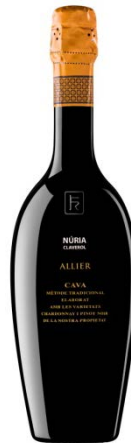
Allier Chardonnay 36 mesos criança