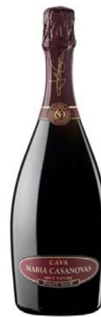
Rosat Pinot Noir Pinot Noir 12 mesos criaça