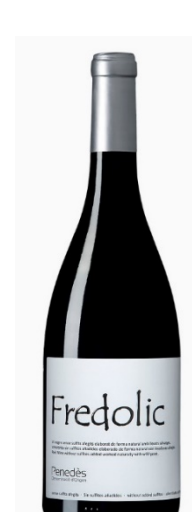
Fredolic Natural Cabernet Sauvignon