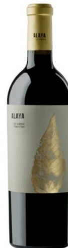
Alaya Garnacha Tintorera 15 meses barrica