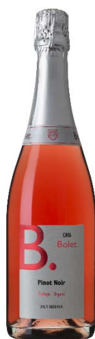
Brut Rosat Pinot Noir Pinot Noir 100 %