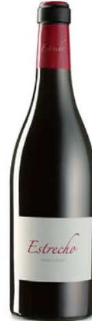
Estrecho Monastrell 14 meses barrica