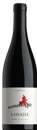
Losada Mencia 12 meses barrica