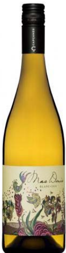
Mas Donís Blanc Garnatxa blanca Macabeu