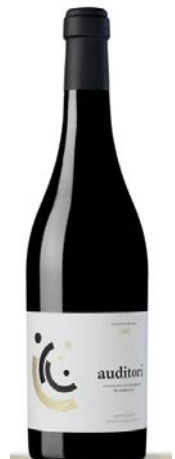
Auditori Garnatxa negra 13 mesos barrica