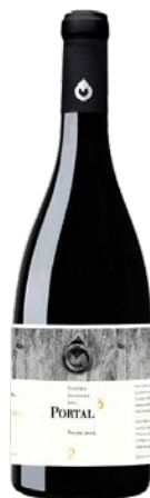
Portal 60% Garnatxa 15% Carinyena 10% Merlot 15% Syrah 12 mesos barrica