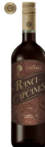
Ranci Garnatxa Vi de licor 36 mesos