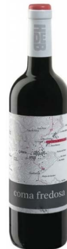
Coma Fredosa 67% Cabernet sauvignon 33% Garnatxa negra 11 mesos en barrica