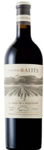
Lo Grau 100% Garnatxa