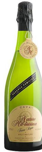
Natura Mil·lessima Reserva Familiar Macabeu, Xarel·lo, Parellada 30 mesos criança