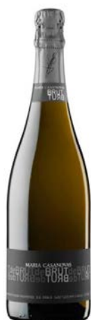
Brut de Brut Parellada, Macabeu, Xarel·lo De 18 a 24 mesos criaça