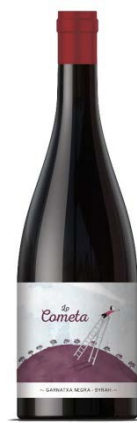
Lo Cometa Negre Garnatxa/Syrah