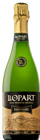
Panoràmic 50% Xarel·lo 40% Macabeu 10% Parellada 42 mesos criaça