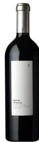
Mather Teresina 40% Garnatxa 30% Carinyena 30% Morenillo 20 mesos barrica