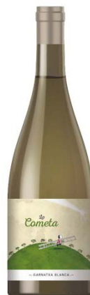
Lo Cometa Blanc Garnatxa