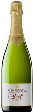
Brut Reserva Macabeu, Xarel·lo Parellada, Chardonnay 24 mesos criança