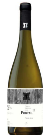
Portal 85% Garnatxa b 5% Sauvignon b 5% Viognier 5% Macabeu