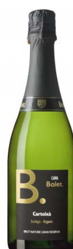
Cartoixà Gran Reserva Brut Nature 100 % Xarel·lo.