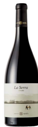
La Serra 80% Samsó 20% Garnatxa negra vinya vella 12 mesos barrica