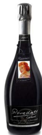
Colecció GR Cartells i Plaques modernistes Xarel·lo, Parellada