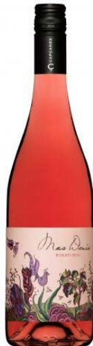
Mas Donís Rosat Garnatxa, Samsó Syrah, Merlot