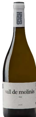
Vall de Molinàs Blanc 100% Garnatxa Blanca