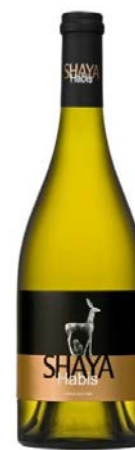
Shaya Habis Verdejo vinya vella 7 mesos barrica