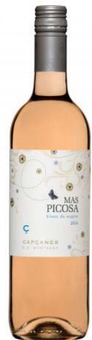
Mas Picoosa Blanc de Noirs Garnatxa tinta