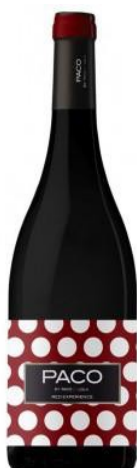
Paco 100% Mencia