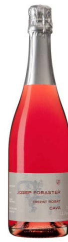
Cava Trepat Rosat 100% Trepat