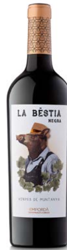
La Bestia Negra 80% Garnatxa 20% Cabernet Sauvignon Vinyes de Muntanya