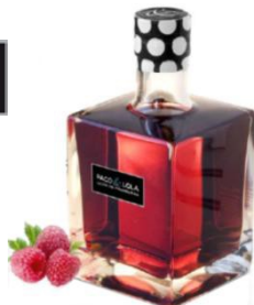
Licor de frambuesa

Orujo de albariño frambuesa macerat 3 mesos