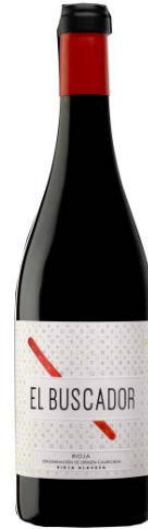
El Buscador Tempranillo 90% Garnacha 10% 12 mesos barrica