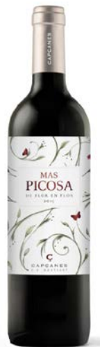
Mas Picoosa (ecològic) 40% Garnatxa 40% Samsó 10% Merlot 10% Ull de llebre 4 mesos barrica