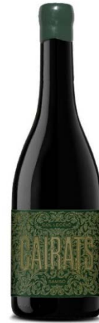
Cairats Col·lecció Samsó