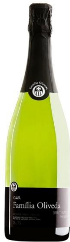
Familia Oliveda BN Reserva Macabeu, Xarel·lo 18 mesos criança