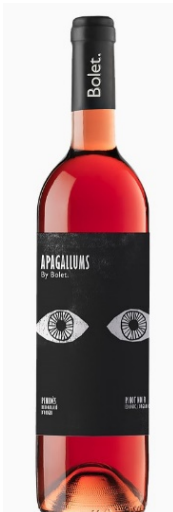
Apagallums Ecològic Pinot Noir 100%