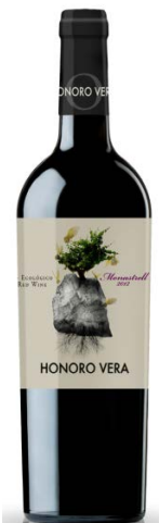
Honoro Vera (Ecològic) Orgànic Monastrell