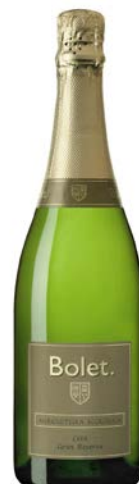
Brut Nature Gran Reserva Macabeu, Xarel·lo i Parellada.