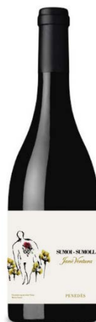
Sumoll 100% Sumoll 12 mesos barrica