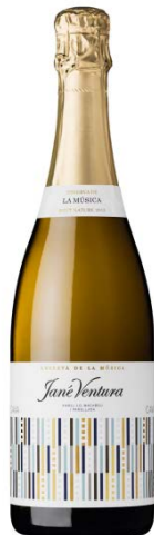
Rva. de la Música BN Xarel·lo, Macabeu, Perellada 24-30 mesos criança