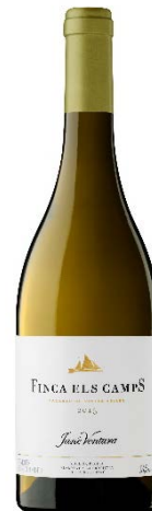
Finca Els Camps Macabeu i Malvasia Fermentat en barrica 5 mesos criança