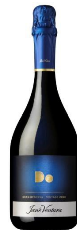
Gran Reserva "DO" 60% Xarel·lo, 26% Macabeu 14% Parellada 45 mesos criança