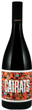
Cairats Garnatxa, Samsó Ull de llebre 3 mesos barrica