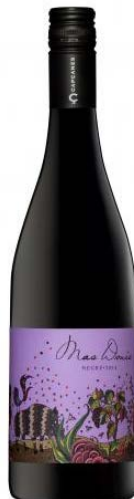
Mas Donís Negre Ull de llebre, Garnatxa Merlot, Syrah, Samsó