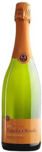
Familia Oliveda Brut Jove Macabeu, Xarel·lo, Parellada 12 mesos criança