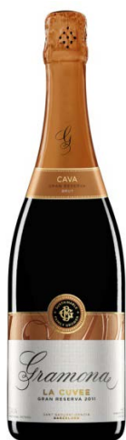
La Cuvée Brut Gran Reserva Xarel·lo, Macabeu 36 mesos criaçça