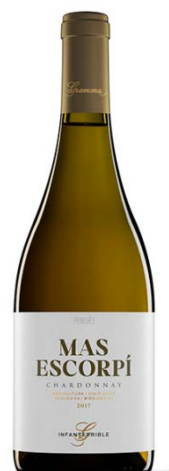
Mas Escorpí Chardonnay (ecològic)