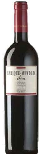
Shiraz crianza Shiraz 13 meses barrica