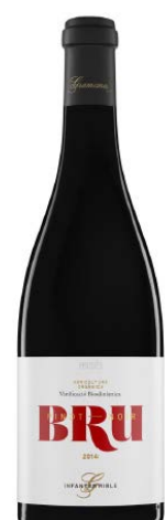
Bru Pinot Noir Pinot noir 8 mesos barrica (Biodinàmic)