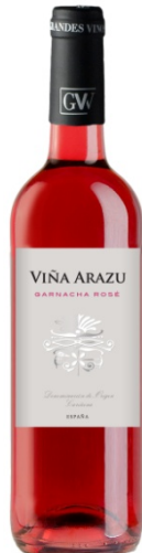
Viña Arazu Rosat Garnatxa