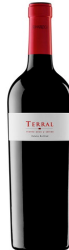
Terral Cabernet Franc, Syrah Merlot, Cabernet Sauvignon 12 mesos barrica