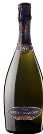
Gran Reserva BN Macabeu, Xarel·lo Parellada Chardonnay, Pinot Noir 30 mesos criaça