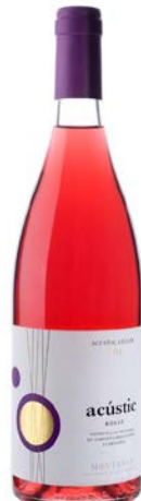
Acústic Rosat Garnatxa negra Garnatxa gris Samsó Fermentat en barrica