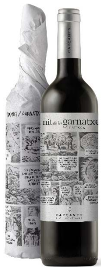
Calissa Garnatxa 6 mesos barrica