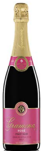
Rosat Pinot Noir Pinot Noir 24 mesos criaçça