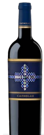
Can Blau 40% Carinyena, 40% Syrah 20% Garnatxa 12 mesos barrica