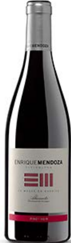
Pinot Noir Pinot Noir 10 meses barrica