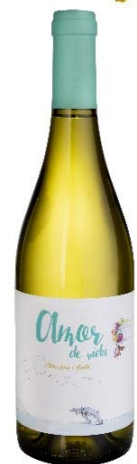
Amor de vida blanc Macabeu 80% Parellada 20%