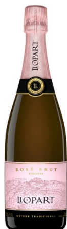
Llopart Rosé Monastrell 60% Garnatxa 20% Pinot Noir 20%