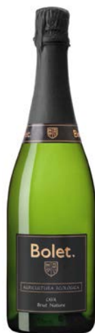
Brut Nature Reserva Macabeu, Xarel·lo i Parellada.