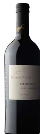
Taberner N1 Syrah