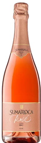
Brut Rosé Pinot Noir 14 mesos criança