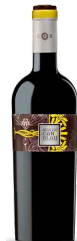
Mas de Can Blau 35% Carinyena, 35% Syrah 30% Garnatxa 18 mesos barrica