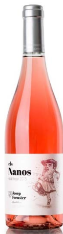
Els Nanos 100% Trepat