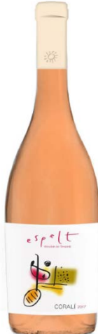
Coralí ecològic Garnatxa