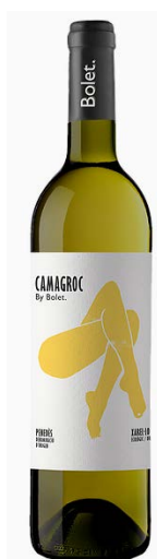
Camagroc Ecològic Xarel·lo 100%