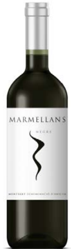
Marmellans Negre D.O Catalunya Samsó Ull de Llebre Garnatxa