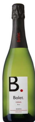
Brut Reserva Macabeu, Xarel·lo i Parellada.