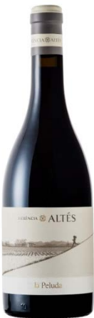
La Peluda 100% Garnatxa peluda