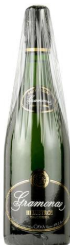
III Llustros Gran Reserva Brut Nature Xarel·lo, Macabeu + 5 anys criaçça