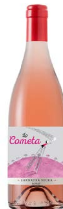
Lo Cometa Rosat Garnatxa Negra