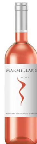
Marmellans Rosat D.O Catalunya Garnatxa Ull de Llebre Samsó