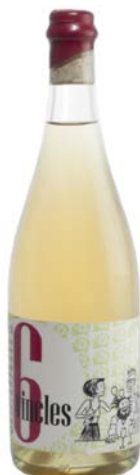
6 Vincles Pansa blanca