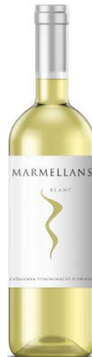
Marmellans Blanc D.O Catalunya Macabeu Garnatxa blanca