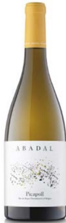
Picapoll 100% Picapoll