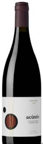
Acústic Negre Garnatxa, Samsó 13 mesos barrica