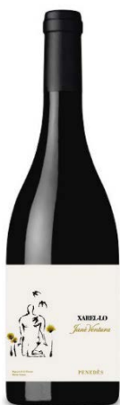
Xarel·lo 4 mesos de criança en barrica i anfora