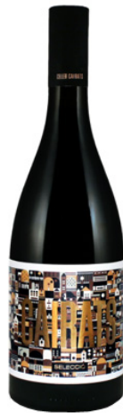
Cairats Selecció Samsó, Garnatxa 12 mesos barrica