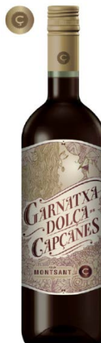
Garnatxa (dolça) Vi de licor 36 mesos