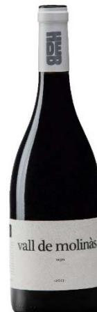
Vall de Molinàs 100% Garnatxa vermella